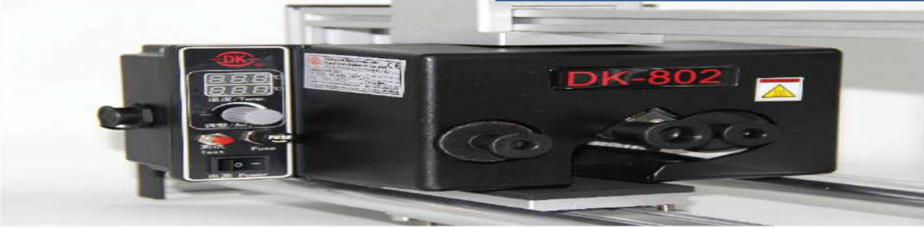
Type Holder Assy